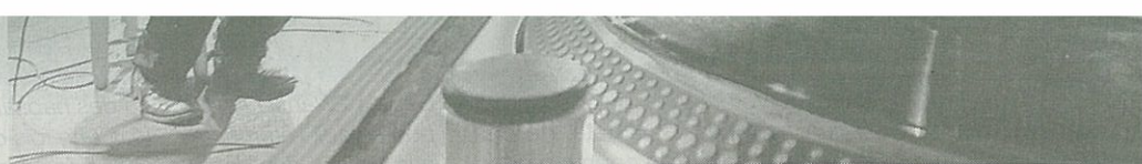
Un concert aux vertus préventives.

Peace and Love n'est pas qu'un spectacle mais une action globale de prévention des risques auditifs avec des outils appropriés : mise en ligne