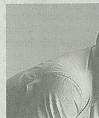
Avishai Cohen, contrebassiste de renommée mondiale, fait salle comble à Onyx.

Jeudi 14 avril, à 20 h 30 à Onyx, tél. 02 28 25 25 00.