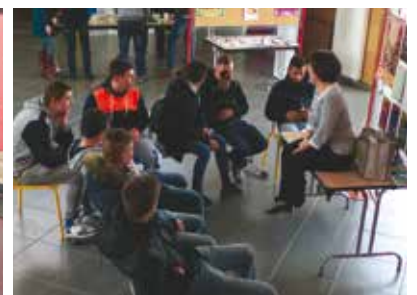
Temps d'échange apprentis/intervenante sur la vie affective