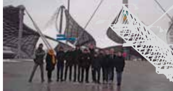
Olympiapark - Munich

En visitant le «Salon du bâtiment, de la couleur et de la façade», les jeunes ont découvert de nouveaux concepts dont l'isolation thermique par l'extérieur.