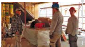
BP maçons européens sur un chantier à Dresde