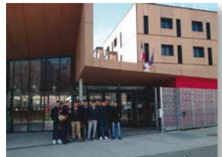
Le groupe des BTS 1 ère année