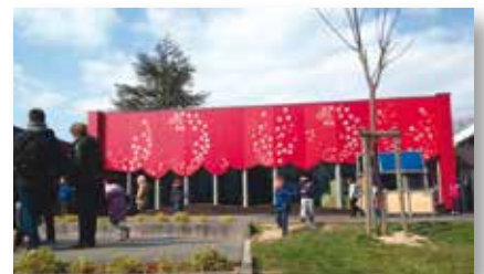
Lycée Albert Camus

L'objectif de ce déplacement : analyser les contraintes à prendre en compte dans l'élaboration d'un projet architectural à partir d'un bâtiment existant, tout en respectant les données environnementales et normatives.