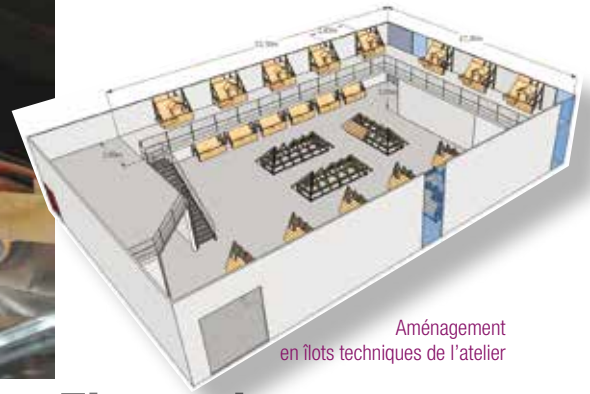
Aménagement en îlots techniques de l'atelier