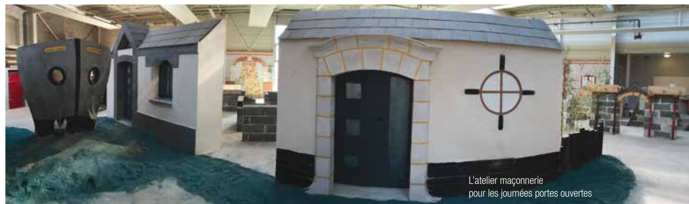
L'atelier maçonnerie pour les journées portes ouvertes

De nombreuses actions sont menées pour faciliter le recrutement d'apprentis et permettre de s'appuyer sur cette période de relance dans le bâtiment pour continuer à former nos professionnels de demain.