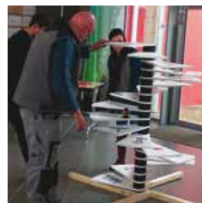
L'escalier des discriminations

Les actions menées annuellement leur permettent de mieux comprendre les problèmes liés aux addictions et leurs risques professionnels ; les sensibiliser sur la vie affective, les bons usages des réseaux sociaux ; les discriminations, et être plus attentif aux comportements routiers. Cette année nous avons souhaité mettre l'accent sur les conduites à risques, notamment les consommations d'alcools et de produits stupéfiants, afin de responsabiliser les apprentis, et d'être le déclencheur d'une prise de conscience au moment d'entrer dans le monde du travail. Les projets sont menés avec des partenaires, Avenir Santé, ANPAA, Cité Métissé, Le Triangle... Toutes ces actions ont pour but de permettre à l'apprenti d'être informé et de se construire en réfléchissant à ses choix.